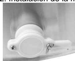
Figura 3: Instalación de la tapa de la salida de la miel (puede variar según el modelo)