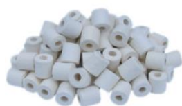
Anillos de cerámica