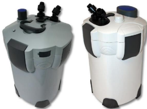
Imágenes similares, pueden variar según el modelo

Lea atentamente las instrucciones de funcionamiento e indicaciones de seguridad contenidas en este manual antes de usar por primera vez el dispositivo.