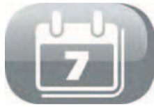
Programmation sur 7 jours