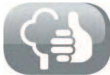
Respectueux de l'environnement (CO2 neutre)