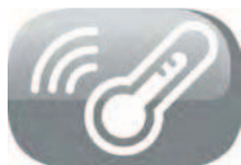
Programmation de la température