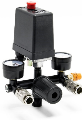
Immagine a scopo rappresentativo, può variare a seconda del modello

Prima di mettere in funzione il dispositivo, leggere e seguire le istruzioni per l'uso e le indicazioni di sicurezza.