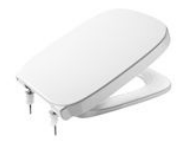
SQUARE - Tapa y asiento para inodoro con caída amortiguada