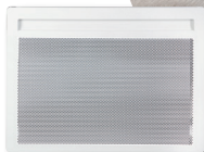
HORIZONTAL 500, 750, 1000, 1250, 1500 et 2000 W