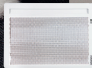
HORIZONTAL ECODOMO 300, 500, 750, 1000, 1250, 1500 et 2000 W