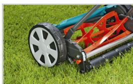
FACILE DA MANOVRARE E