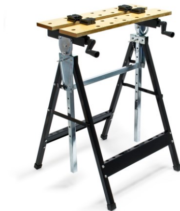
Illustration similaire, peut varier selon le modèle

Veuillez lire et respecter le mode d'emploi et les consignes de sécurité avant la mise en service.