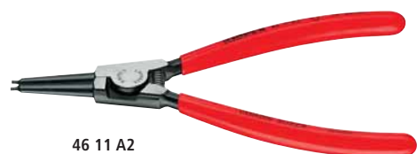
46 11 A2