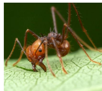
Formica - hormiga del campo

Colocar las trampas por donde las hormigas se mueven o se encuentran presentes, cerca de paredes, en la cocina, terrazas y para una máxima eficacia en la entrada del hormiguero.