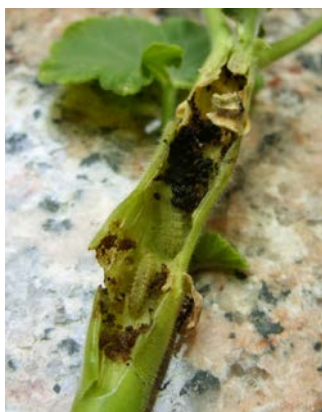
Daños ocasionados por la oruga

El ANTI-TALADRO del GERANIO Listo Uso , es especialmente efectivo para el control, tanto preventivo como curativo del taladro del geranio