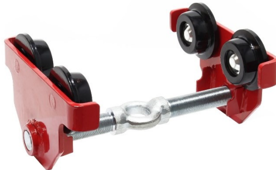
Illustration similaire, peut varier selon le modèle

Veuillez lire et respecter le mode d'emploi et les consignes de sécurité avant la mise en service.