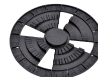
Flasque doté de crans et de repères de hauteur