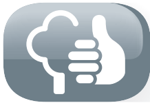
Respetuoso del medio ambiente