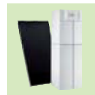
TWINEO EGC 17/29 ou 25 / V100SL