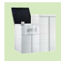
TWINEO EGC 17/29 ou 25 / V 200SSL