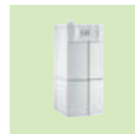
TWINEO EGC 17/29 ou 25