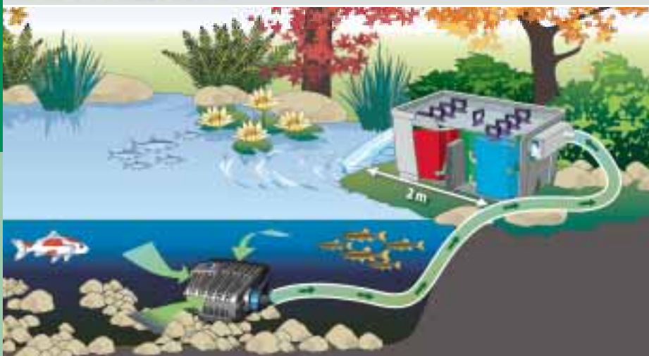
Représentation schématique : BioSmart 36000 en combinaison avec la pompe pour filtres et ruisseaux AquaMax Eco Classic