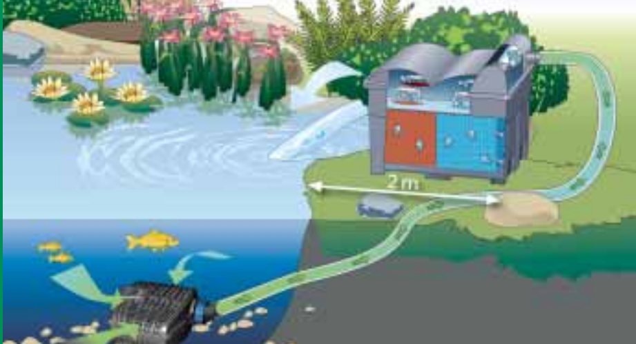
Représentation schématique : BioSmart UVC 16000 en combinaison avec la pompe pour filtres et ruisseaux AquaMax Eco Classic