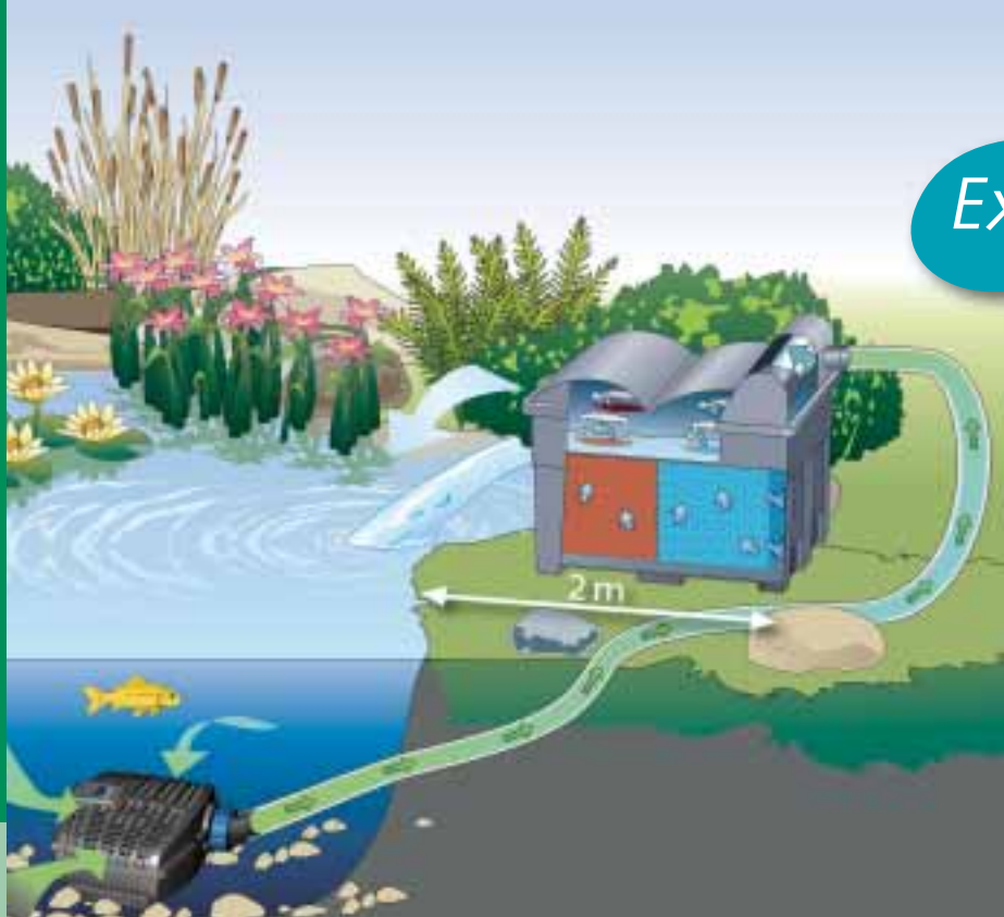
Représentation schématique : composants du BioSmart Set en fonction