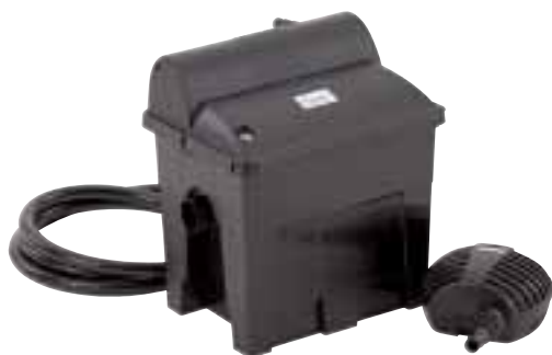
BioSmart Set 5000