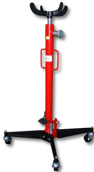
Illustration similaire, peut varier selon le modèle

Veillez lire et respecter le mode d'emploi et les consignes de sécurité avant la mise en service.