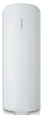
Vertical Mural 50, 75, 100, 150 et 200L