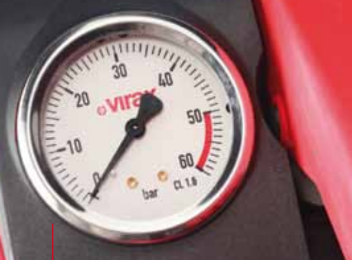
Manomètre 50 bar