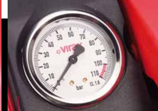
Manomètre 100 bar