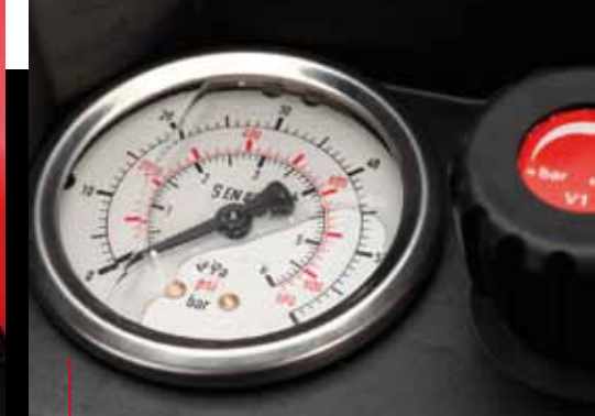
Manomètre à glycérine