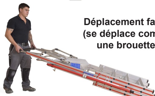
Déplacement facile (se déplace comme une brouette)