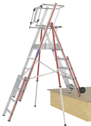
Utilisation possible dans des escaliers