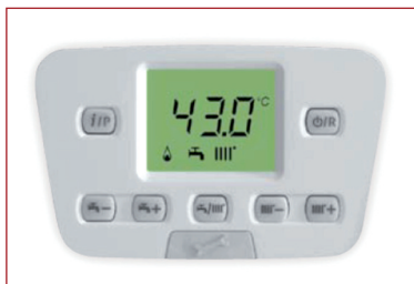
Tableau Initia Plus HTE rétro-éclairé

Initia Plus HTE dispose d'un tableau de commandes convivial avec un écran indicateur rétro-éclairé. Boutons indépendants de réglage de la température de chauffage et ECS. Affichage par codes de toutes les informations et les paramètres de fonctionnement.