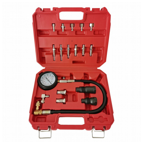
Immagine similare, può variare a seconda del modello

Prima della messa in funzione del dispositivo leggere e osservare le istruzioni per l'uso e le norme di sicurezza.