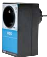
HDS 6,5 A