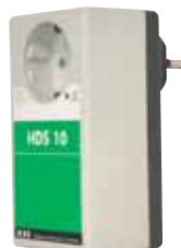
HDS 10 A