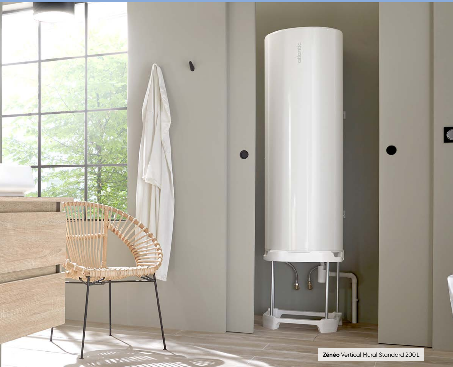
Zénééo Vertical Mural Standard 200 L