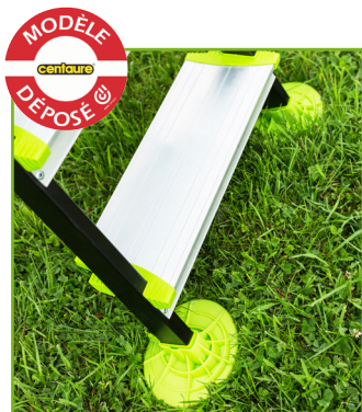
Sabots " Spéciale pelouse " emboîtables

Idéal pour la taille des haies, des arbustes, la cueillette et autres travaux de jardinage.