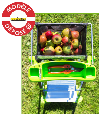
Porte-outils et panier détachable