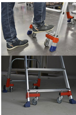
Roues escamotables et patins antidérapants