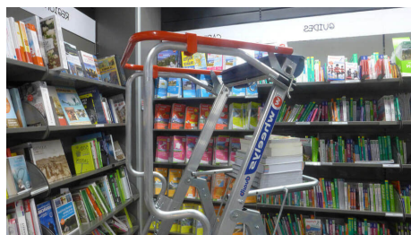
Tablette porte-outils et garde-corps