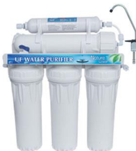
Illustration similaire, peut varier selon le modèle

Veillez lire et respecter le mode d'emploi et les consignes de sécurité avant la mise en service.