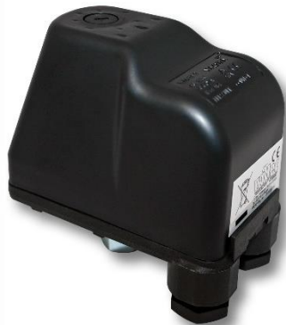
Illustration similaire, peut varier selon le modèle

Veillez lire et respecter le mode d'emploi et les consignes de sécurité avant la mise en service.