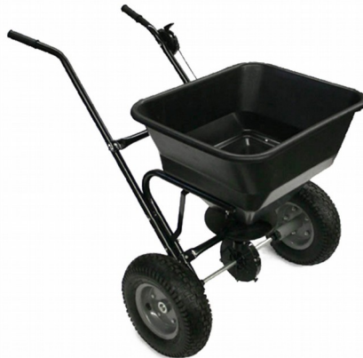
Illustration similaire, peut varier selon le modèle

Veuillez lire et respecter le mode d'emploi et les consignes de sécurité avant la mise en service.