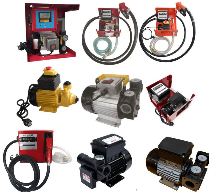
Illustration similaire, peut varier selon le modèle

Veuillez lire et respecter le mode d'emploi et les consignes de sécurité avant la mise en service.