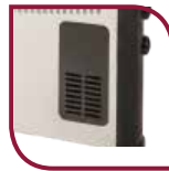
Ventilateur «Turbo» Incorporé TLS 503 T