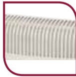
Grille de diffusion