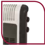
Boutons de commande