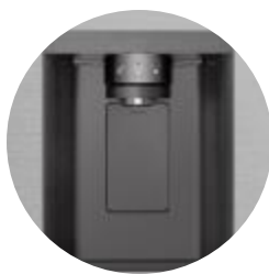
Distributeur d'eau épuré