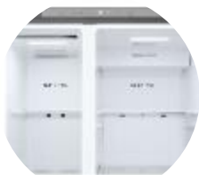
Affichage intérieur discret