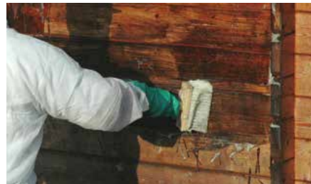
Appliquer AQUANETT® sur bois sec. Laisser agir 5 mn puis rincer à grande eau.