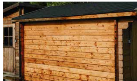
Immédiatement après rinçage, sur bois encore mouillé, appliquer NET-TROL®***. Le laisser agir 15/20 mn puis rincer à grande eau.

Les informations exposées ci-contre sont données à titre indicatif et n'engagent pas la responsabilité du fabricant, l'application des produits n'étant pas faite sous son contrôle.