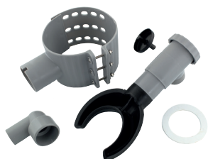
Kit complet prêt à poser