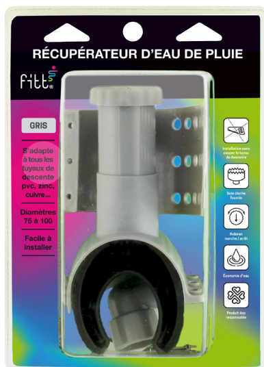
Produit sous blister brochable (Notice au verso)