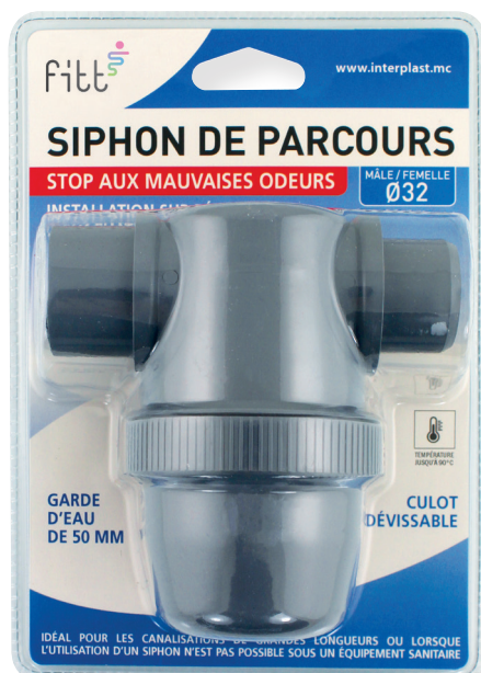
Produits sous blister brochable Disponibles en Ø32 et Ø40 (notice d'installation au dos)