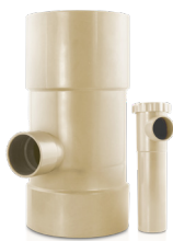
Installation facile sur le tuyau de descente