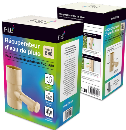
Emballage carton individuel (Notice au verso)