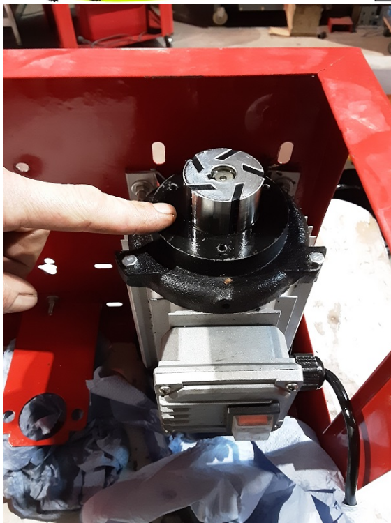
Retirer le rotor de pompe.