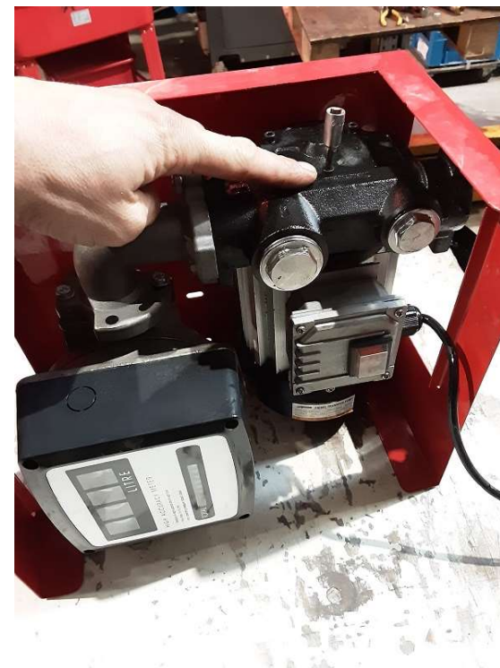
Retirer les vis du corps de pompe.