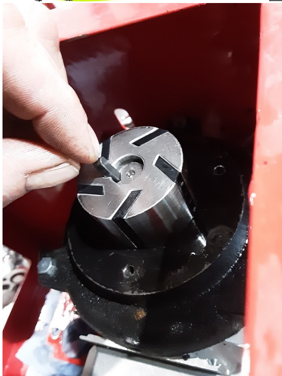
Replacer la cale.