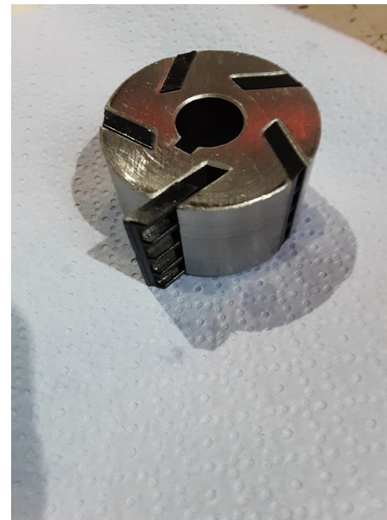
Nettoyer le rotor.