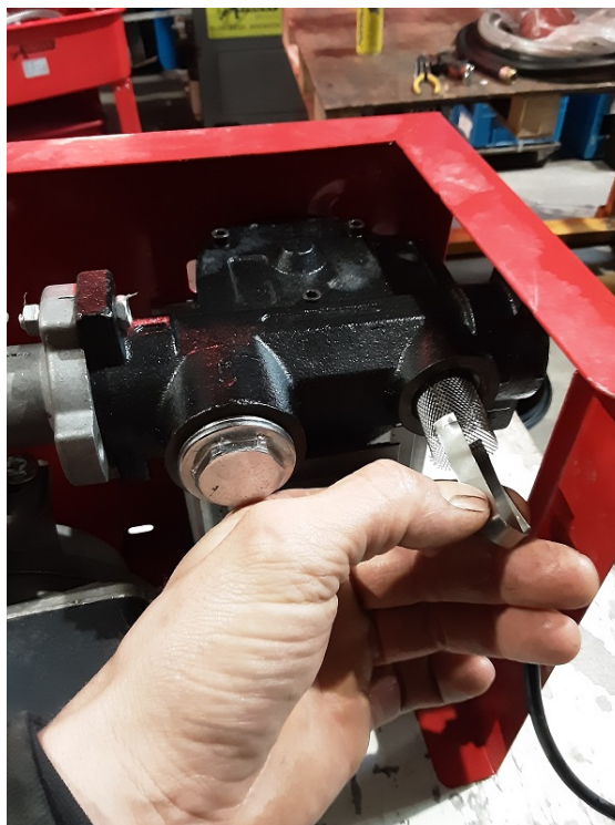
Retirer la crepine filtrante et la nettoyer.