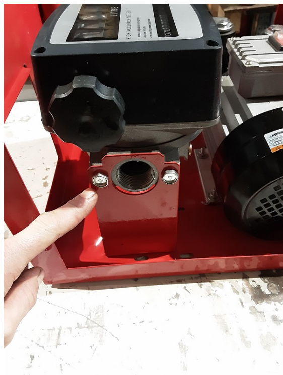
Démonter la fixation compteur.