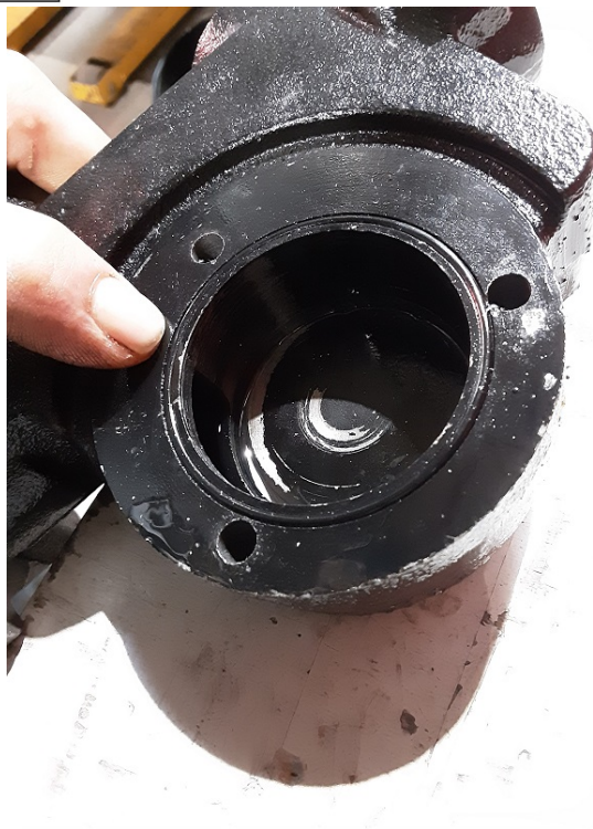
Nettoyer le corps de pompe et s'assurer qu'aucune impureté n'est logée dans celui-ci.