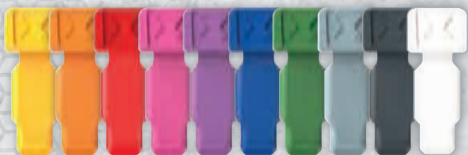
KNIPEX ColorCode Clips