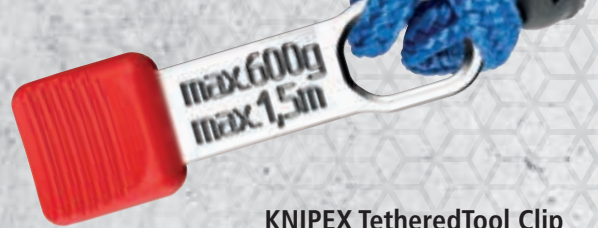
KNIPEX TetheredTool Clip