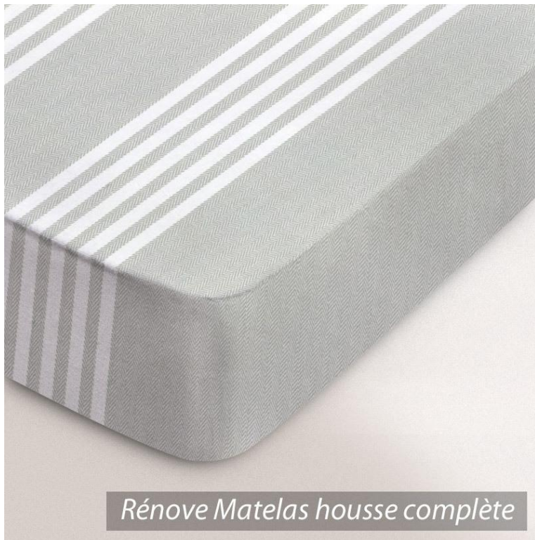
Rénove Matelas housse complète