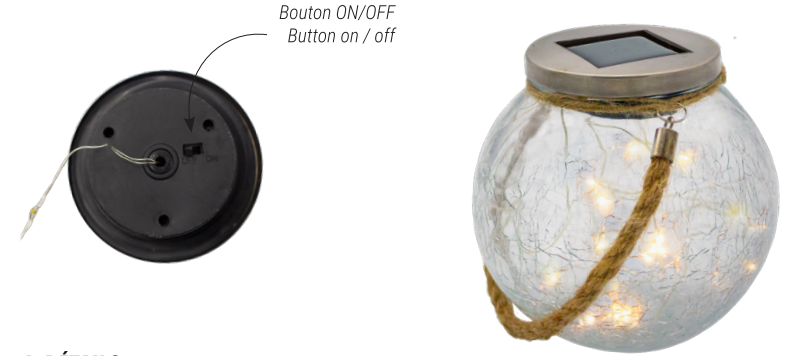
Bouton ON/OFF Button on / off