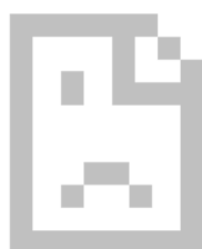
imagen no disponible