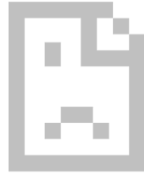
imagen no disponible